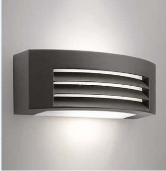
Apliques pared exterior en pared. Modelo Fragance Antracita o similar