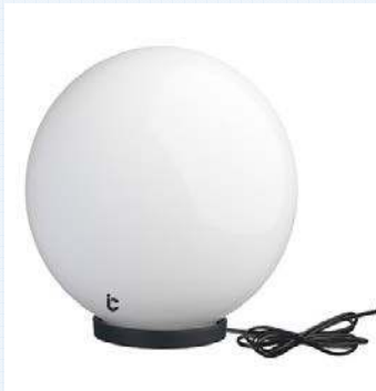
Apliques pared exterior en pared. Modelo DOPO GLOBO o similar