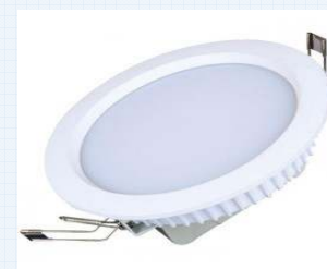
Downlight empotrables techo Ecolux o similar