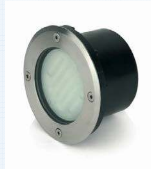
Ojos de buey empotrables (Piscina). Modelo IP65 PHILIPS o similar