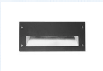
Apliques pared exterior en solárium, Modelo Micenas o similar