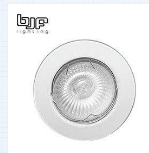
Ojos de buey empotrables techo. BGF o similar